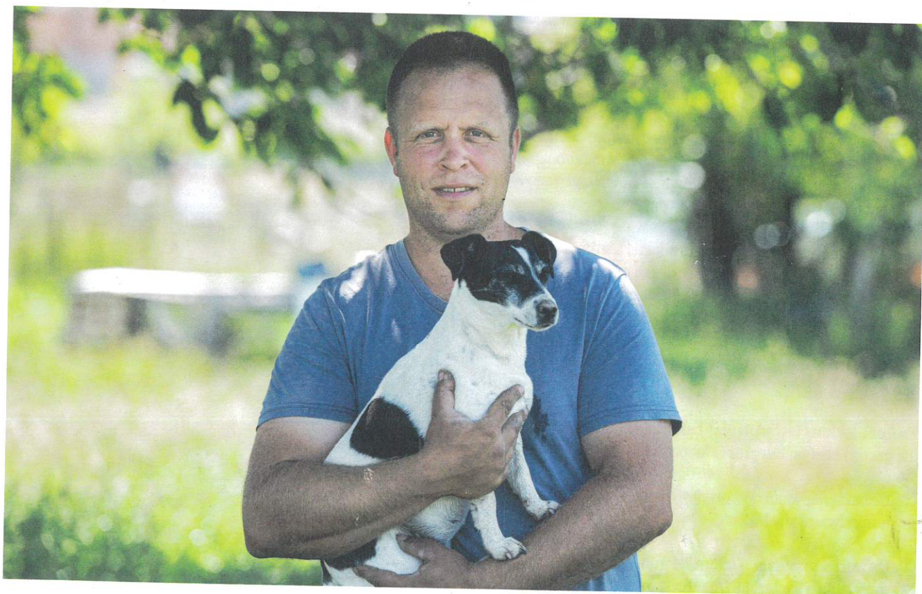
Alexander Kerbusch van vzw Haal meer uit je tuin . haalmeeruitjetain.be

Om groei en productie te optimaliseren gaan we bemesten, want voor ons tuiniers en telers is productie belangrijk. Afgelopen eeuwen kienden we voor iedere teelt allerlei recepten uit met als focus topopbrengsten. Plantgezondheid en andere neveneffecten hadden we minder in beeld.